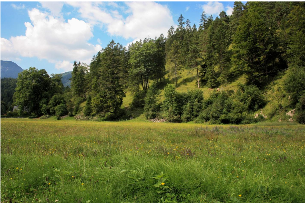
Abb. 2: Magerweide am Hangfuß des Ofenbergs im Oberen Loisachtal.